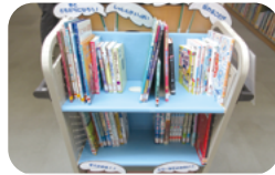
西部図書館での様子