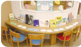
市民図書館での様子

市民図書館では「ことばのはねをひろげよう」と題して、司書おすすめの児童書と、そのなかの魅力的な一節を引用したカードを展示。西部図書館では、「本や図書館と、も～となかよくなるう！」と題して、本や図書館が登場するお話を集めた展示を行いました。