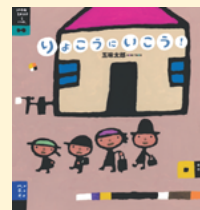
せいぎゅうまごう 請求記号 PN コ

りょうこうにでかけるのは、人間 にんげん だけではありません。いつもはおるすばんしているおうちも「りょうこうにいつてきまーす」とで出かけます。のりものやふねに乗 の って、せかい た び た の の 楽しさを力強く、親しみのあるタッチで描 えが いています。ユーモラスなツッコミにもくすつと笑 わら ってしまう楽しい絵本 えほん です。