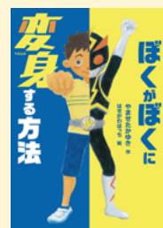
せいぎゅうまごう 請求記号 91 ヤ

ヒーロー「サンダー仮面 かめん 」にあこがれるタクミは、フリーマーケットで变身ベルト へんしん を手に入れます。それを同級生 どうきゅうせい に乱暴 らんぼう に投げられ、怒 おこ ったタクミは彼 かれ にやり返 かえ したいと思 おも い、ポーズをとると、本当にサンダー仮面 かめん に大変身 だいへんしん ！ところが困 こま ったことに、戻 もど り方がわかりません。どうすれば元 もと の姿 すがた に戻 もど れるのでしょうか？タクミと同級生 どうきゅうせい たちの成長 せいちょう 物語 ものがたり です。