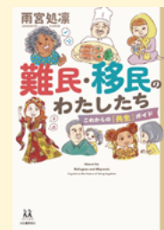
せいぎゅうまごう 請求記号 32 ア

“難民 なんみん ”や“移民 いみん ”について、私 わたし たちはどれくらい知 し っているのでしょうか。世界 せかい にはさまざまな理由 りゆう で、国 くに を逃 のが れてきた人 ひと たちが数 かず 多くいます。この本 ほん では、当事者 とうじしゃ や支援者 しえんしゃ の話 はなし を聞き、現 げん 在 ざい の日本 にほん で暮 く らす“難民 なんみん ”“移民 いみん ”の実態 じつたい を紹介 しょうかい しています。遠 と い国 くに の話 はなし ではない、身近 みぢか な問題 もんだい として考 かんが えるための入門 にゅうもん 書 しょ です。