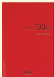
請求記号 K 577

百貨店やパティスリーで、心がときめくようなクッキー缶に出会ったことはありませんか？ギフトや自分へのご褒美に購入したくなる方もいるのではないのでしょうか。その魅力は、焼き菓子の味わいだけでなく、ユニークな型抜きや美しいデザインの缶や包装紙、ショッパーにも詰まっています。本書では、誰もが知る名店からホテルの限定品、個人店まで、120種以上のクッキー缶を掲載。ブランドの歴史や名缶誕生秘話なども紹介され、シェフやお店のこだわりを知ることができます。クッキー缶の楽しみ方が広がる1冊です。