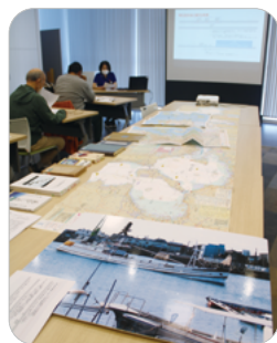
過去の講座の様子