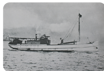
明石型生船 第一新生丸

今回のふね遺産認定を記念して、あかし市民図書館では、生船内での乗組員の仕事や生活風景を知ることができる講座と展示を実施します。この機会にぜひ、明石にとって重要な産業遺産といえる生船について学んでみませんか？