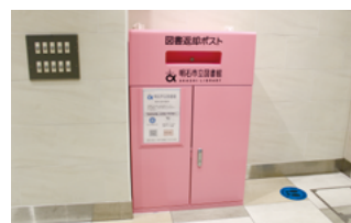
ピオレ明石の返却ポスト